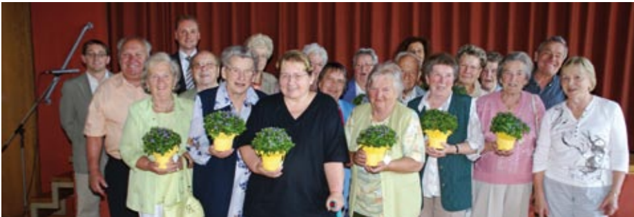
Strahlende Gesichter bei der Jubiläumsfeier: Blumen und Gutscheine für Serviceleistungen als Geschenk für 50 Jahre Treue.