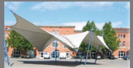
Die WBL unterstützt die Filmakademie Ludwigsburg.

■ Gerade arbeite ich an dem Projekt „Stillstand“, das wir am Sonnenberg in Ludwigsburg drehen. Es ist eine Koproduktion der deutsch-französischen Masterclass der Filmakademie. Sie wird von ARTE und SWR unterstützt. Es geht um einen Fabrikarbeiter in Zeiten der Wirtschaftskrise und um die Frage, ob er lügt, um seinen Job zu retten, oder ob er zu seinen moralischen Prinzipien steht.